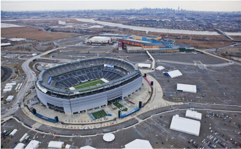
Metlife Stadium en New Jersey