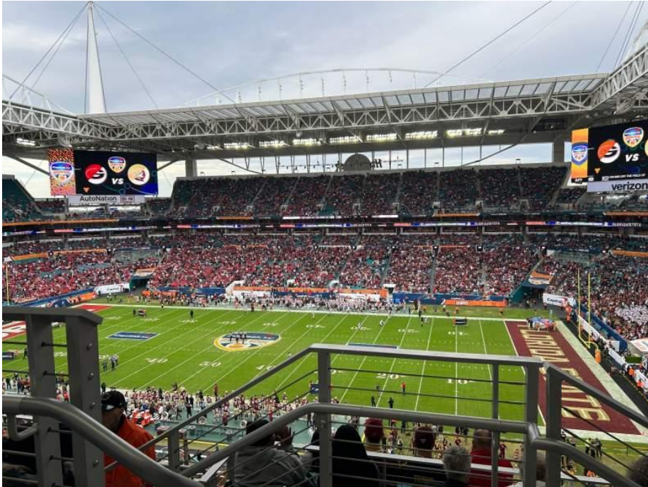
Hard Rock Stadium