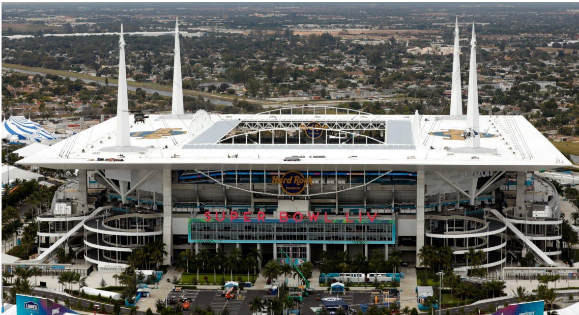
Hard Rock Stadium