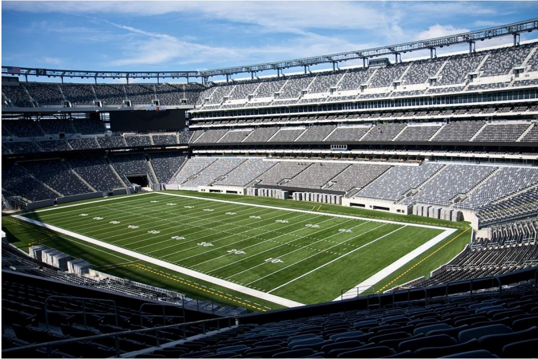
Metlife Stadium en New Jersey