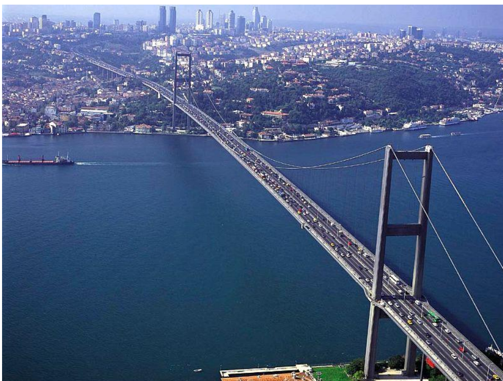
Puente del Bósforo o Puente Bogazici

El vano central tiene una longitud de 1074 m y la altura de los pilares desde donde cuelgan los cables es de 165 m y la altura sobre el nivel del mar de 64 m.